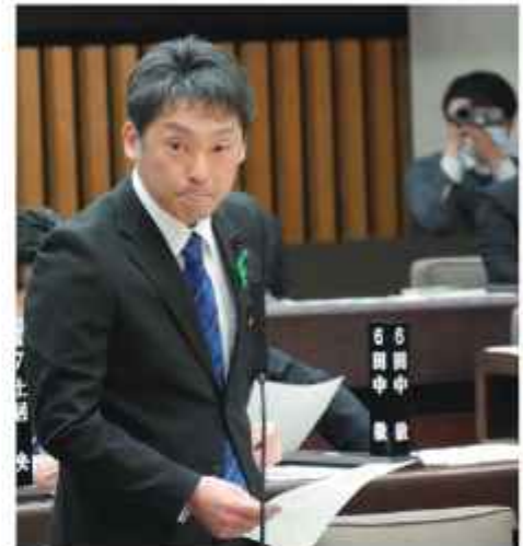
2月定例会で一般質問を行う