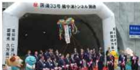
国道 33 号 橘中津トンネル開通式典