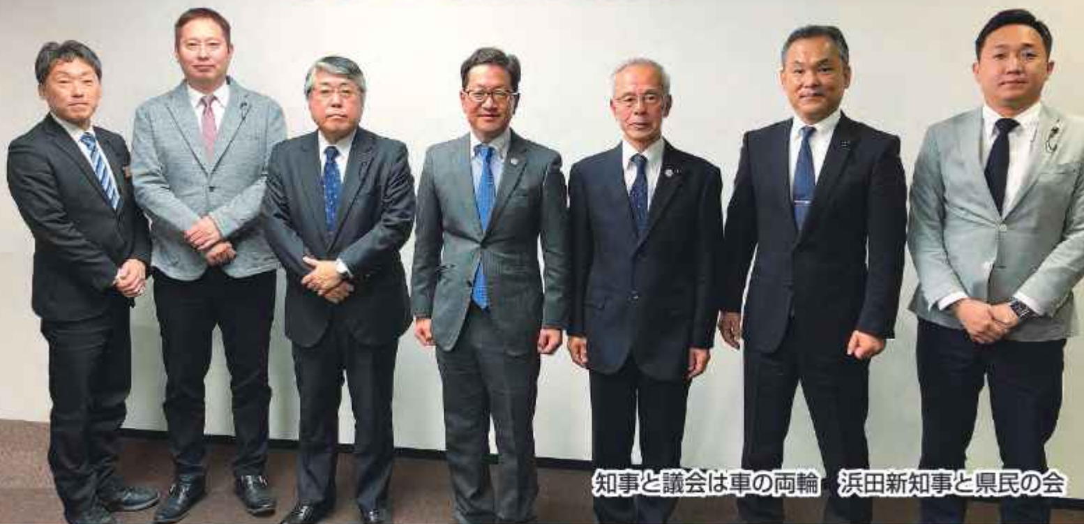
知事と議会は車の両輪 浜田新知事と県民の会