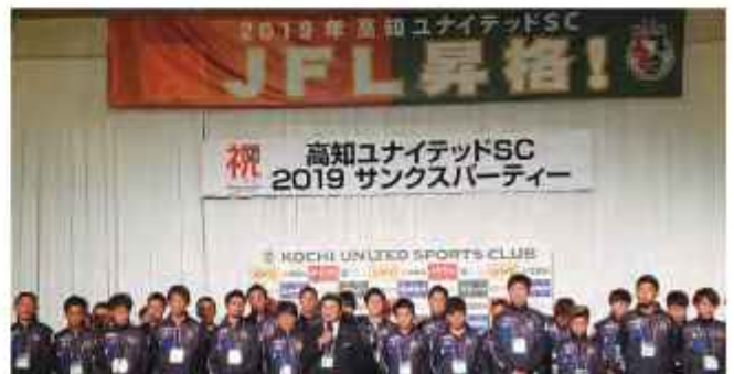
JFL 昇格を果たした高知ユナイテッド SC

答 【文化生活スポーツ部長】 会場や練習場の確保、クラブの運営費用などの課題があり、他県の例も参考に、Jリーグ入りを果たすためにどういった支援策が可能か検討したい。