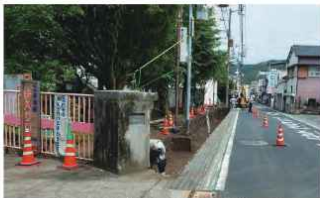
安全な通学路を（佐川小学校ブロック塀改修工事）

【大野】 学校に行かない、行けない子どもが増える中、学校での集団学習を基本としながら、家庭での遠隔教育や地域の公民館や集会所での学習を認めるなど、柔軟な環境や体制を考えるべき時期にきていると考える。