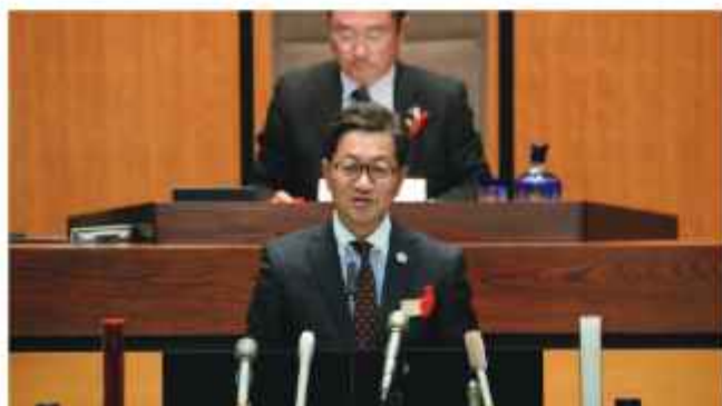
答弁する浜田新知事

答 【浜田知事】 不登校の児童生徒や特別な支援を要する子供への重点的な支援など、厳しい環境にある子供達への支援の充実特に意を払ってまいりたい。