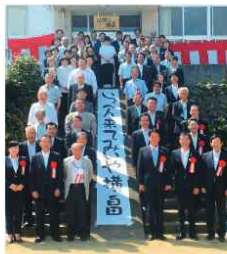
集落活動センター山笑ふ横島開所式