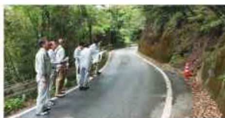
県道 18 号危険箇所調査