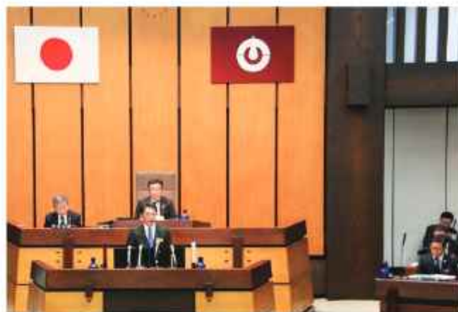
令和元年12月定例会で浜田知事に初質問