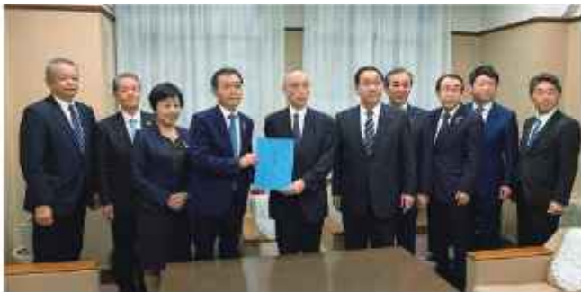
国道 33 号財務省への整備促進要望

答 【土木部長】 「高知市旭駅前通交差点」電停構造などの協議を進め、早期の工事着手を目指す。 「高知西バイパス」全線開通に向け舗装工事などに着手。 「日下橋」令和 2 年度の完成を目指す。 「川内ヶ谷橋」令和 2 年度から用地買収に着手する。 「越知道路 2 工区」令和元年度末に現道の対岸を通るトンネル工事を契約予定。 県としてそれぞれの事業箇所の整備が着実に進められるよう、直轄負担金の確実な確保などにしっかりと取り組んでまいります。